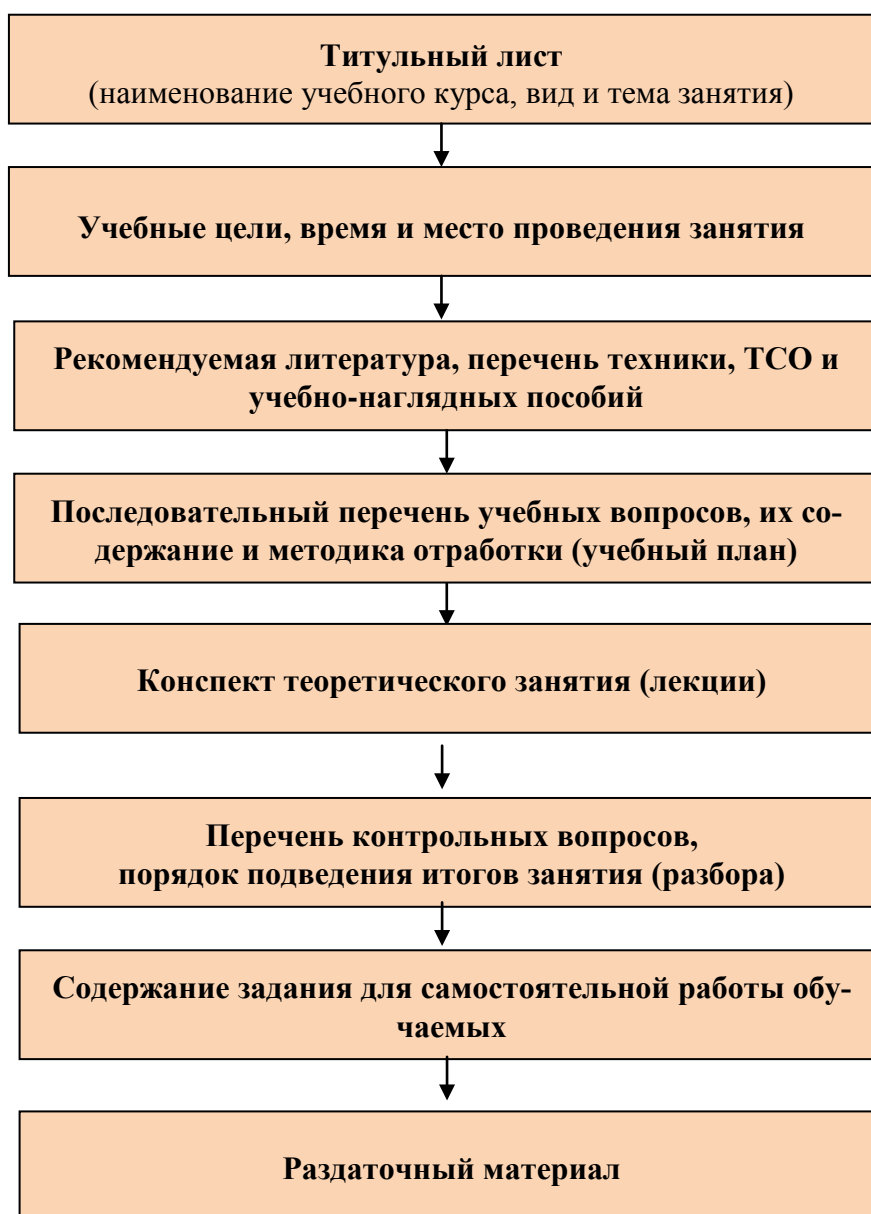
Рис.2. Структура методической разработки учебного занятия.

Учет выполнения методических мероприятий ведется путем отметки в месячных планах работы, оформлением протоколов педагогического совета.