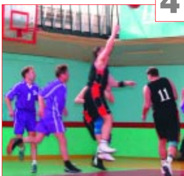
Десятая Спартакиада ОАО «Нижновэнерго»

Победителями в командном зачете стали спортсмены Сормовской ТЭЦ